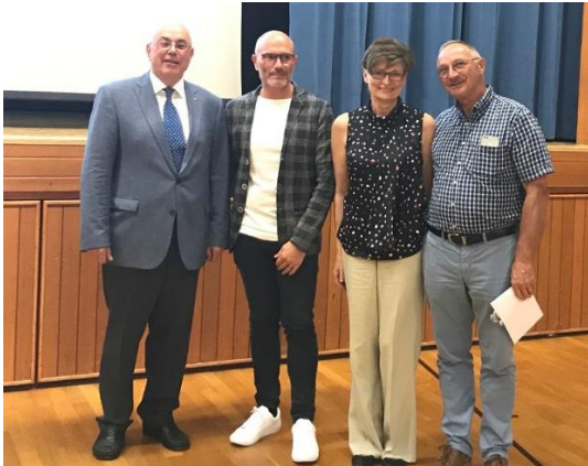
Ehrung der Sektionsveteranen / 30 Jahre im Verband