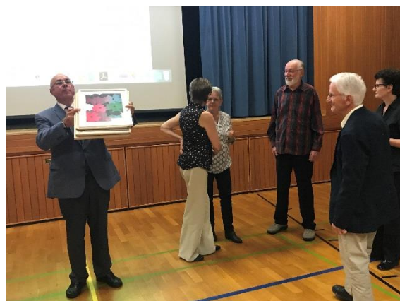
Ehrung der Veteranenmitglieder KV Schweiz / 50 Jahre im Verband